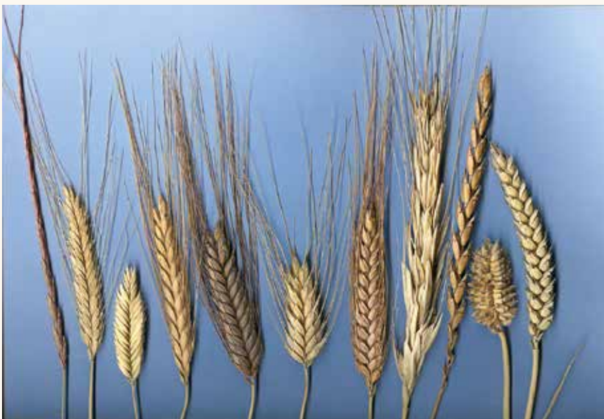
Vetets många former.