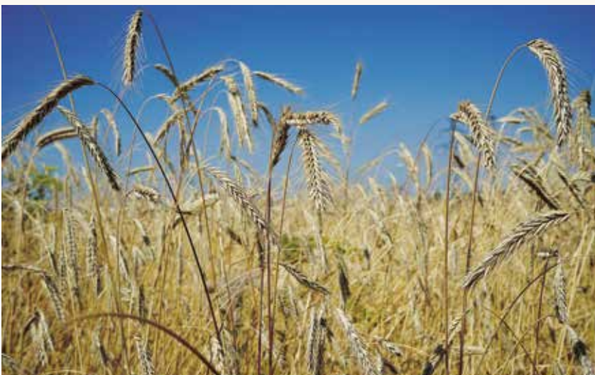
Allkorns evolutionära vårråg.

Anmälan lämnas senast måndag den 29 juli till Östen Holmström på oh@kvarken.se eller telefon 0705-552288. Ange namn, adress, telefon och e-postadress. Deltagarantalet är begränsat. Principen "först till kvarn" gäller. Bekräftelse med deltagarlista och vägbeskrivning skickas ut ett par dagar före mötet.